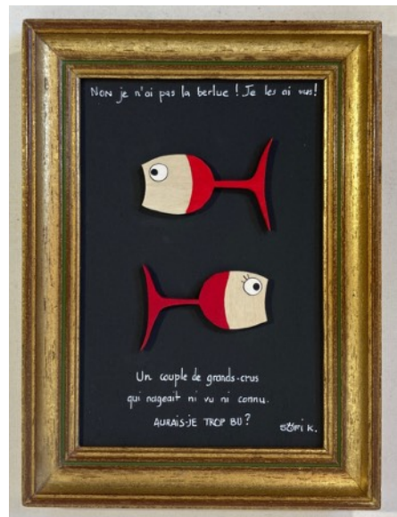
Couple de grands crus