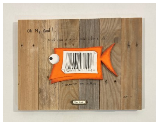
Bar à code

"Toujours en quête de prospérité — Honoré voyage en parachute doré — Poisson d'affaire jamais rassasié."