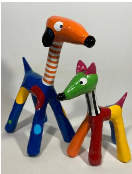
RAF & DOB duo